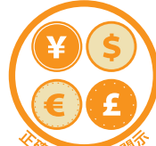
正確な財務情報開示

私たちは、反汚職、独占禁止及び国際取引に係る法令を含む全ての適用法令を遵守します。