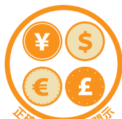
正確な財務情報開示

私たちは、反汚職、独占禁止及び国際取引に係る法令を含む全ての適用法令を遵守します。